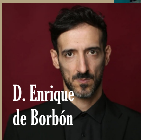
D. Enrique de Borbón