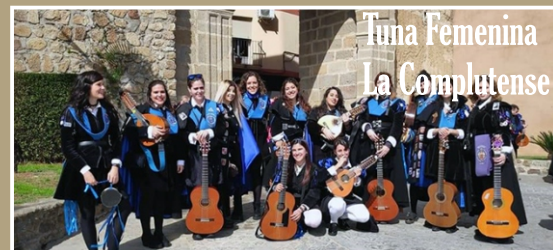
Tuna Femenina La Complutense